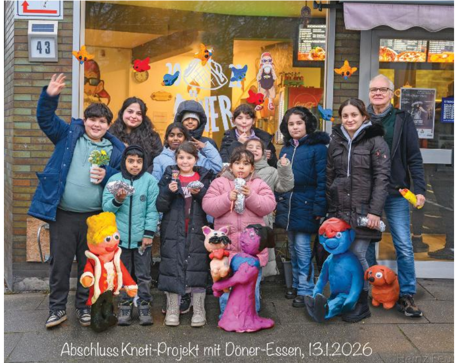
Abschluss Kneti-Projekt mit Döner-Essen, 13.1.2026

Das neue Kinderbuch der Spiel- und Lernhilfe ist nun gedruckt und ab sofort erhältlich. Es erzählt die Geschichte der Knetprinzessin Knina und ihrer Knetkatze Kniau, die aus ihrem Heimatland Knetonien fliehen mussten und in Hamm landeten. Unglücklicherweise wurden die Beiden während der Flucht getrennt. Knina bittet die Kinder der Spiel- und Lernhilfe um Unterstützung bei der Suche nach ihrer Knetkatze. Auf ihrem Weg erkunden die Kinder gemeinsam verschiedene Orte im Stadtteil, sammeln Hinweise und begegnen dabei bekannten Figuren wie Kneti und seinem Hund Knello aus dem ersten Buch der Reihe. Ob Knina ihre Katze wiederfindet, bleibt ein Geheimnis, das die Leser:innen selbst entdecken können. Das Buch