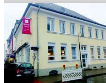
Neue Liegenschaft: Widumstraße 1