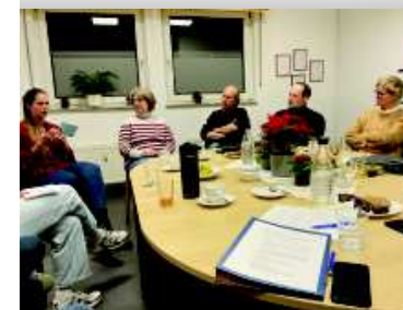
Vorstand - Info aus den Fachdiensten