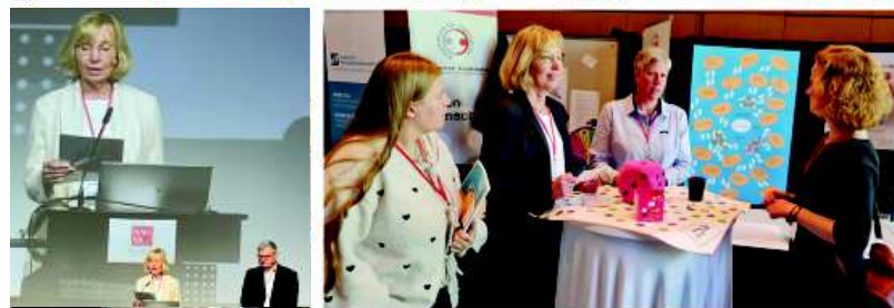
Jahrestagung BAG Schuldnerberatung in Hamm