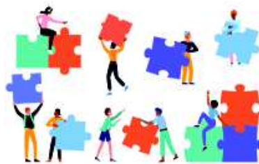
Soziale Arbeit WIR-kt