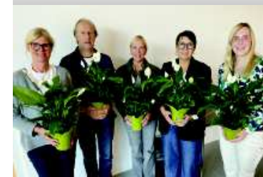
Teil des Vorstands