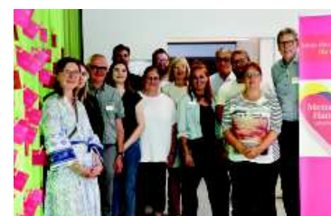
„Mensch Hamm - Lebe Freiheit“