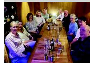
Essen mit Ehrenamtlichen