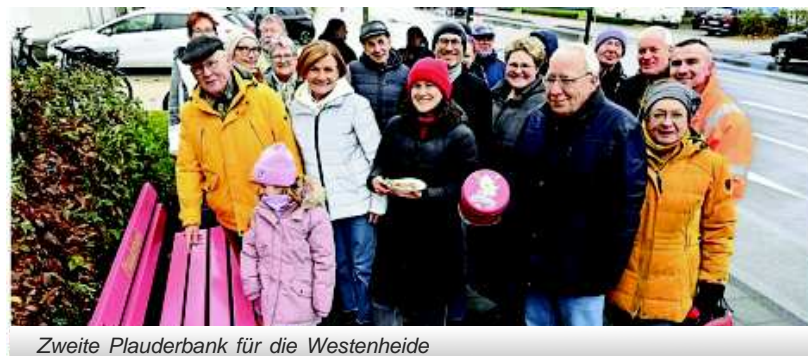
Zweite Plauderbank für die Westenheide

Über Arbeitskreise wie den AK Kinder oder die Koordinierungsrunde lernen sich die Akteure im Stadtteil kennen und stimmen zentrale Themen sowie Veranstaltungen miteinander ab. Die Angebote im Stadtteil sind allen Einrichtungen bekannt und werden gleichermaßen beworben. Dieser Synergieeffekt führt dazu, dass die Organisation von Angeboten für alle Beteiligten gut leistbar ist. Parallelstrukturen wird auf diesem Weg wirksam vorgebeugt.