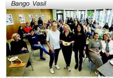
Freude, Vergnügen und Zusammenhalt erlebten die Teilnehmer des Bango Vasil