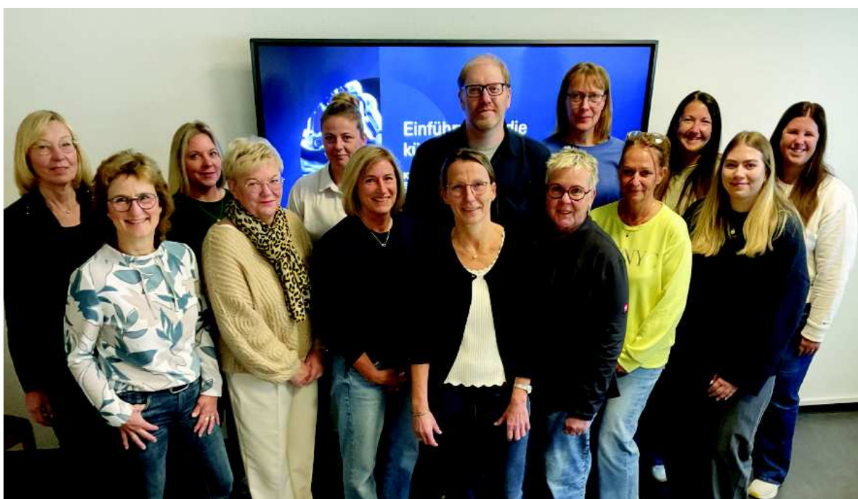
Interne Schulung zum Thema „KI verstehen und im Büroalltag nutzen“

Vor dem Hintergrund zunehmender administrativer Anforderungen wird die Verwaltung auch künftig Wert auf die Weiterentwicklung ihrer Arbeitsprozesse legen. Dabei steht die Qualität der Verwaltungsabläufe, der angemessene Einsatz digitaler Arbeitsmittel sowie die fachliche Qualifizierung der Mitarbeitenden im Mittelpunkt. Ziel ist es, weiterhin einen verlässlichen Rahmen für die Arbeit der Fachdienste zu gewährleisten.