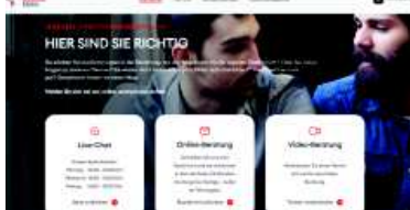
Startseite Digitale Anlaufstelle