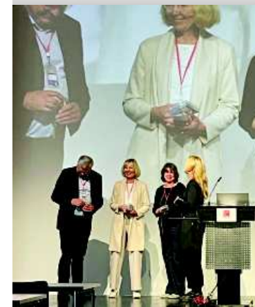
Jahrestagung BAG Schuldnerberatung