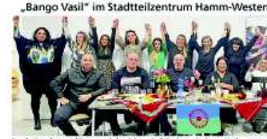
„Bango Vasil“ im Stadtteilzentrum Hamm-Westen