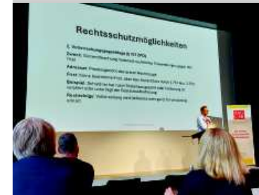
Jahrestagung BAG Schuldnerberatung