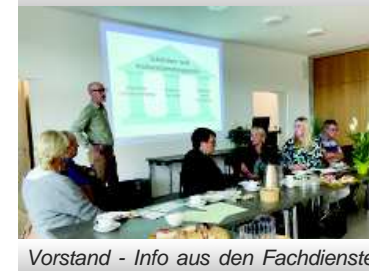
Vorstand - Info aus den Fachdiensten